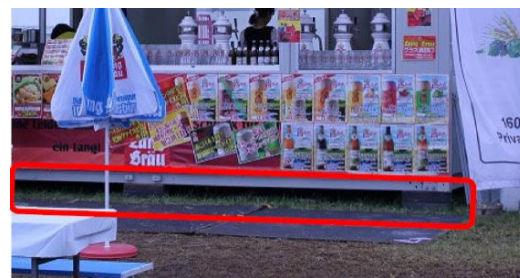
<工作物の空間確保例>