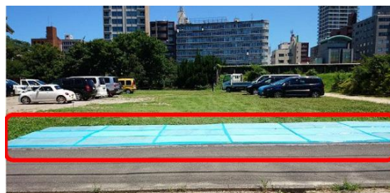
<コンパネによる養生例>