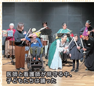
医師と看護師が見守る中、子どもたちは踊った