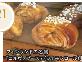
フィンランドの名物「コルヴァプーステ(シナモンロール)」