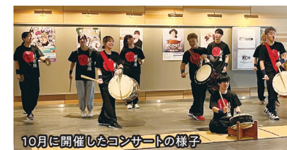
10月に開催したコンサートの様子

エントランスホールやホワイエにて無料のミニコンサートを定期的に開催しています。12月、1月は2つの大学が定期演奏会前にウェルカムコンサートを開催します。