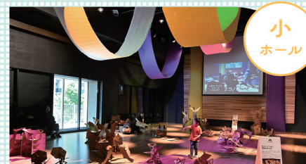
あそびラボ by anno lab