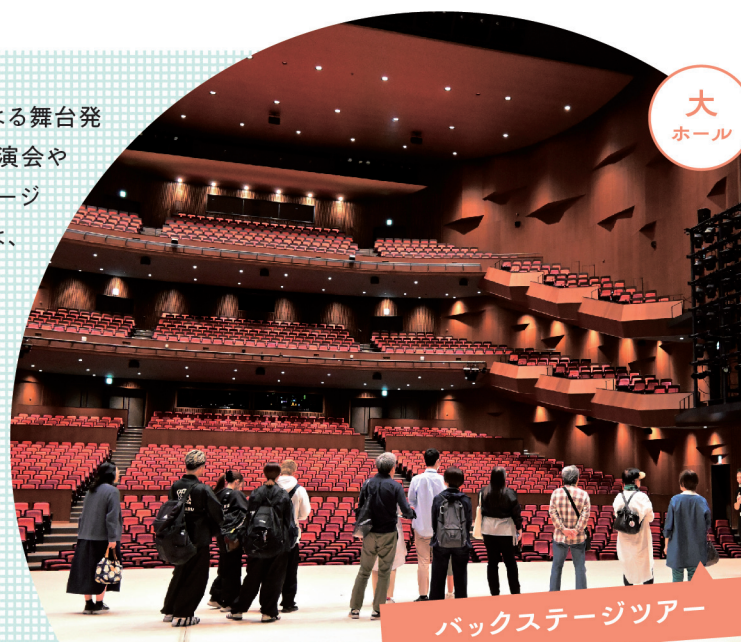
バックステージツアー