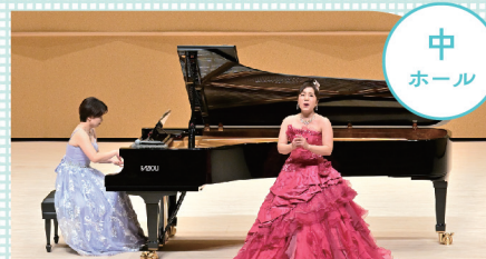
ピアノサポーターと仲間たち ～ミニコンサート～